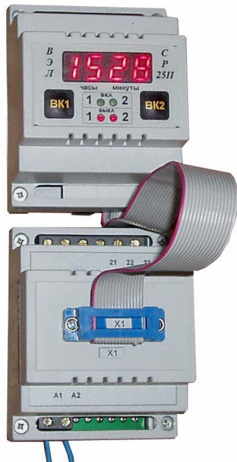
Рис 1. Внешний вид реле

Для программирования уставок реле, контроля и корректировки текущего времени, индикации состояния выхода, к реле, с помощью разъема, подключается блок программирования CP25П (На рисунке 1 вверху).