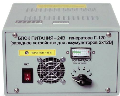
Блок питания БП220/24В (зарядное устройство для аккумуляторов 2x12В)

3.22. Питание вентилятора охлаждения и цифровых индикаторов температуры и напряжения, от внешнего источника питания 12В током, не менее 0,5А (входит в комплект)